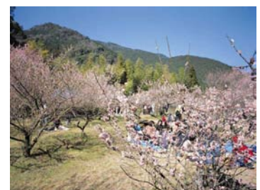
藤川天神の臥竜梅