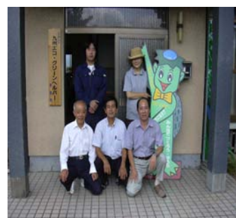
NPOのスタッフです ～私たちがご案内いたします～