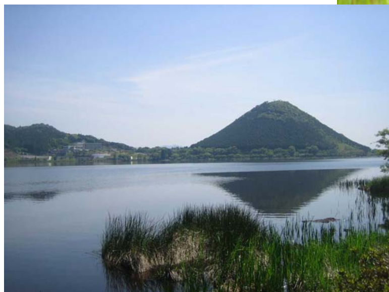
藺牟田池外輪山(飯盛山)と浮島