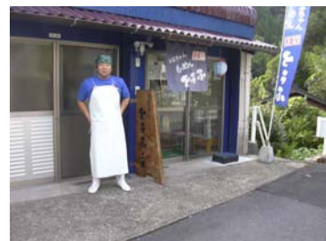
のぶちゃん豆腐店