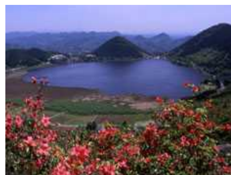
藺牟田池全景 (ラムサール条約登録湿地)