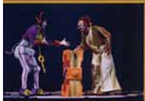
Photo: Kazuyuki Tsukada Cortina: Pierre Spitz Photo: Red Dog Studio Cortina: Pierre Spitz ©2008 Cirque du Soleil