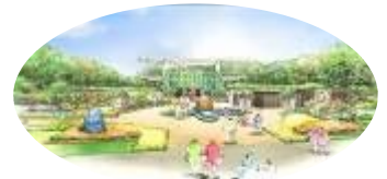
メイン会場屋外展示「おごじの庭」

南北600kmに及ぶ県土を有する鹿児島。本土と28の美しい島々を亜熱帯から温帯の植物、自然や文化等の特徴などで表現した庭。園路を「海の道」に見立て、鹿児島の島々を巡る旅を演出。