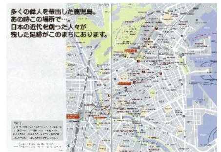
オブジェマップ(詳しくは市HP等をご覧ください)