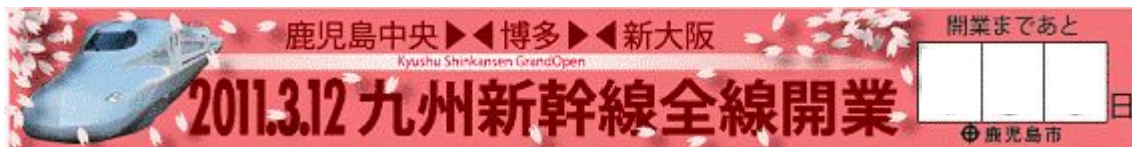
九州新幹線全線開業日までのカウントダウンボードが登場(今後、市役所正面玄関に掲出されます)