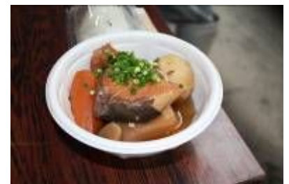
桜島大根の甘みが際立つブリ大根