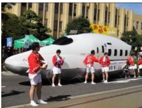
新幹線「さくら」の巨大パルーンも登場 高さとは幅は実物とほぼ同じ3メートル 長さは1車両の半分程の10メートル