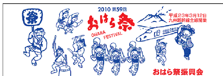
参加者用の手ぬぐいにも九州新幹線全線開業の文字が入る