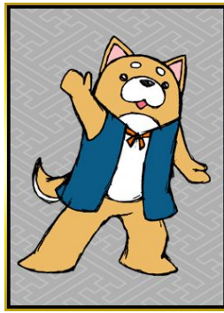
薩摩犬・つんつん