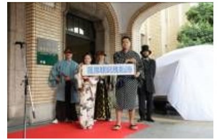
愛称は「薩摩観光維新隊」