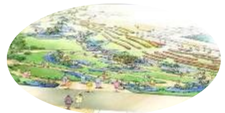
メイン会場屋外展示「島の華園」

南北600kmに及ぶ県土を有する鹿児島。本土と28の美しい島々を亜熱帯から温帯の植物、自然や文化等の特徴などで表現した庭。園路を「海の道」に見立て、鹿児島の島々を巡る旅を演出。