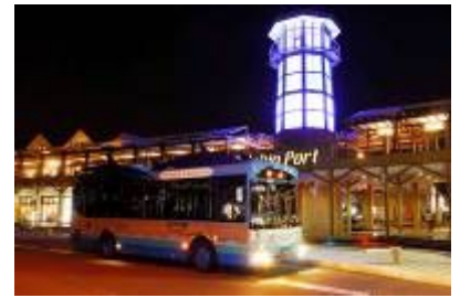
シティビュー夜景コース

12月 3日(金)、4日(土)、10日(金)、11日(土)、17日(金)、18日(土)、24日(金)、25日(土)、31日(金) 1月 1日(土)、7日(金)、8日(土)、14日(金)、15日(土)、21日(金)、22日(土)、28日(金)、29日(土) ※ 2月5日(土)からは通常どおり毎週土曜日