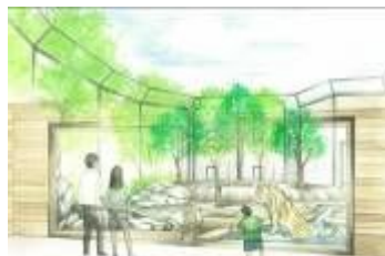
野生のイヌ・ネコゾーン(トラ舎)