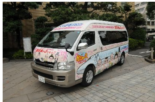
「薩摩観光維新隊」のキャラバンカーにも新幹線がデザイン