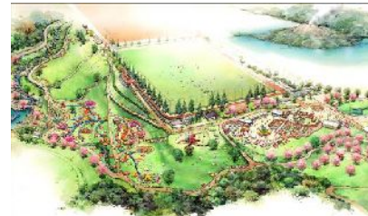
サブ会場 (鹿児島ふれあいスポーツランド)