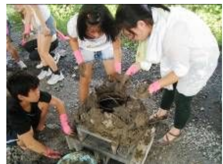
溶岩でピザ釜作り