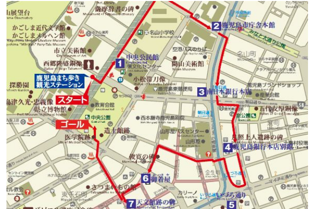
コース図 (天文館のよかとこ!さるっもんそ! 建築遺産・地名再発見)