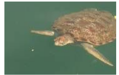
展示中のウミガメ