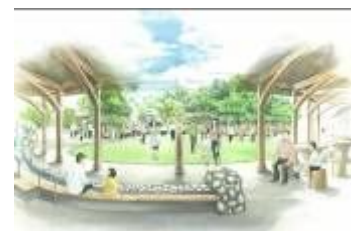
インドの森ゾーン