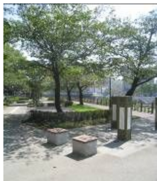
歴史ロード“維新ふるさとの道”