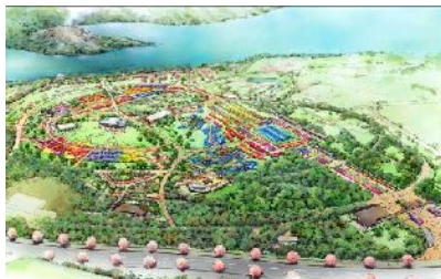
メイン会場 (吉野公園)

期間中、2会場で合計約900種類、110万株の花と緑が会場を彩り、みなさまをお迎えします。メイン会場では、鹿児島のシンボル「桜島」を背景に自治体・企業・団体などの全国規模の庭園による一大花絵巻が出現。サブ会場では、県民・市民と協働で造る花と緑でいっぱいの未来のかごしまのまちが出現。