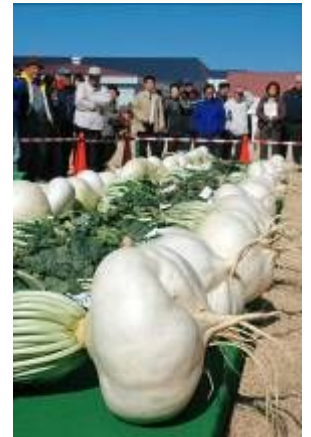
桜島大根コンテスト