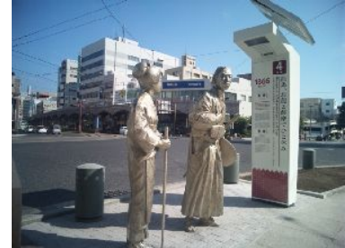
④龍馬、お龍と薩摩でひと休み