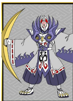
幻魔大帝ヤッセンボー