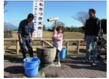
親子もちつき大会の様子