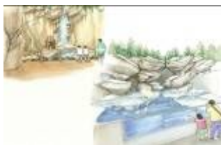
世界のクマゾーン

人気者のゾウを観ながら、子どもづれのお客様でも気軽にゆったりと楽しんでいただけるよう、芝生広場や足湯、授乳室などを設置します。