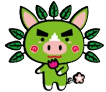
マスコットキャラクター ぐりぶー