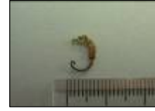
左からイセエビの赤ちゃん、フグの仲間、カニの赤ちゃん、タツノオトシゴの赤ちゃん