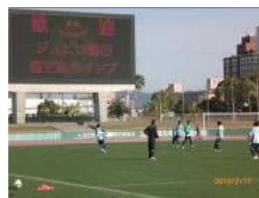
キャンプの様子(ジュビロ磐田)

鹿児島市は温暖な気候と温泉、豊富なおいしい食材で、キャンプ地として人気を集めています。今年の2月もJリーグのジュビロ磐田、清水エスパルス、サガン鳥栖のほか、韓国のプロ野球チーム、女子ソフトボールチームなどがキャンプを実施しました。来年も人気チームがキャンプインする予定で、一流選手のプレーを間近で体験できる絶好の機会となります。