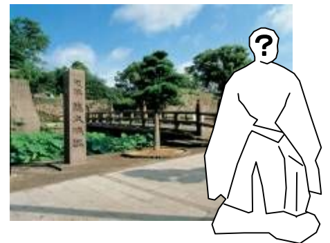
鶴丸城跡に登場する篤姫(天璋院)像