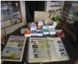
ガイドさん手作りの作品