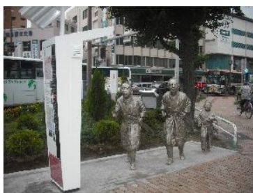
①イギリス艦、鹿児島湾に現る